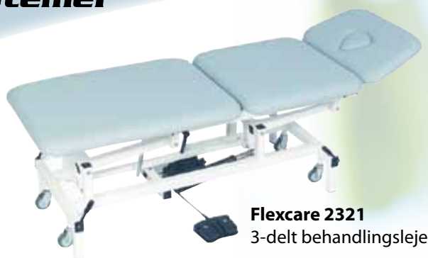
Flexcare 2321 3-delt behandlingsleje