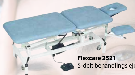
Flexcare 2521 5-delt behandlingsleje