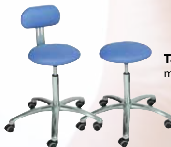
Taburetter med og uden ryglæn