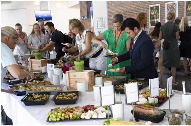
Fagkongressen i september 2023 bød på faglighed og lokale forskere.