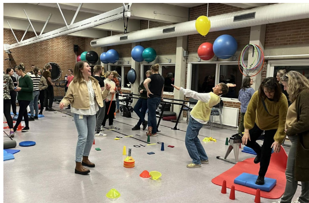
Fyraftensarrangement med balancetræning som tema blev en stor succes som også skabte venteliste.

opbakning fra medlemmerne, og en stærk bekræftelse på, at vi rammer de rette emner.